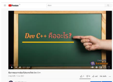
ภาพที่ 1 วิดีโอสื่อการสอนลง Youtube

การทำสื่อการสอนการเขียนโปรแกรมโค้ด Dev C++ สามารถประกอบอาชีพเสริมได้ จากการทำวิดีโอสื่อการสอนอัปโหลดลง Youtube ในการมีรายได้จากการลงสื่อในรูปแบบออนไลน์