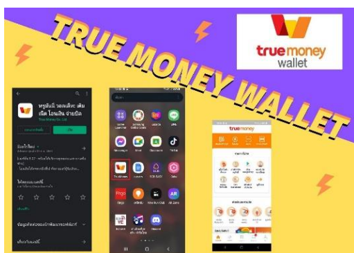
ภาพที่ 1 ตัวอย่างแอป True money wallet

ในสภาวะปัจจุบัน การจ่ายบิลหรือการชำระเงินนั้นเป็นสิ่งที่ยากบางรายการอาจจะต้องไปสถานที่สำนักงานนั้นๆ จึงไม่สมควรเรื่องการเดินทาง การจับต้องธนบัตร การสนทนาและมีโรคโควิด 19 จึงไม่สะดวกที่จะต้องไปสถานที่ ใด ๆ ต้องชำระเงินซึ่งแอปพลิเคชัน True money wallet เป็นอีกทางเลือกหนึ่งที่ควรเลือกใช้ ซึ่งเป็นแอปที่สามารถชำระรายการที่ต้องชำระผ่านทางแอปได้โดยไม่ต้องไปสถานที่นั้นๆ ทำให้สะดวก และง่ายต่อการชำระเงินมีวัตถุประสงค์เพื่อให้ผู้ใช้สามารถจ่ายบิลค่าน้ำค่าไฟ หรือ ฯลฯ ได้สะดวกสบายมากขึ้นและลดความเสี่ยงต่อการติดเชื้อโดยขั้นตอนการจ่ายบิลแบ่งออกเป็น 2 วิธี 1.แบบไม่ต้องผูกบัญชีธนาคารกับตัวแอป 2.แบบผูกบัญชีธนาคารกับตัวแอป โดยขั้นตอนการไม่ผูกบัญชีต้องเติมเงินเข้าไปในตัวแอปโดยการเติมเงินที่หน้าเคาเตอร์ของ 7-Eleven และกดเบอร์โทรศัพท์ที่เป็นบัญชีของ True money wallet เพื่อเป็นการเติมเงินเข้าแอป และขั้นตอนผูกบัญชีสามารถเข้าที่ตัวแอปและกดผูกบัญชีและใส่เลขที่บัญชีที่แอปต้องการเป็นการผูกบัญชีเสร็จสิ้น และการจ่ายบิล นำบิลที่จะจ่ายมาสแกน QR Code หรือ บาร์โค้ด หน้าบิลและกดจ่ายบิลได้เลยเป็นอันเสร็จสิ้น