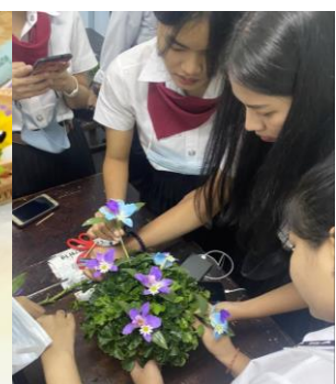
ภาพที่1 หลักวิชาการ