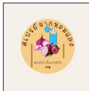
ภาพที่ 2 โลโก้ผลิตภัณฑ์