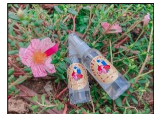
ภาพที่ 3 ผลิตภัณฑ์สเปรย์จากหอมแดง